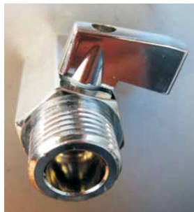
Zawór spustowy tłuszczu z tacy ociekowej filtra TurboSwing.