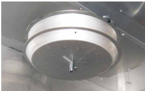
Unikalna konstrukcja filtra TurboSwing dostępna jest we wszystkich typach okapów tłuszczowych Jeven.

Rozwiązanie TurboSwing to nie tylko bardzo wysoka skuteczność odseparowywania tłuszczu z wywiewanego powietrza, ale również łatwość utrzymania wysokiej higieny oraz prostota konserwacji. Personel kuchenny może zapomnieć o żmudnym cotygodniowym czyszczeniu filtrów tłuszczowych okapu kuchennego, a całkowicie skoncentrować się na procesie gotowania.